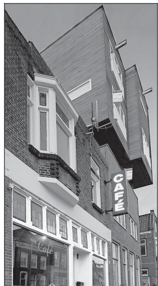
Café De Buren, de uitvalsbasis van B. en L.

De Drentse supermarkt- en restaurant-eigenaar is ten einde raad. Hij zegt in de tang van B. en L. te zitten. Door de im-